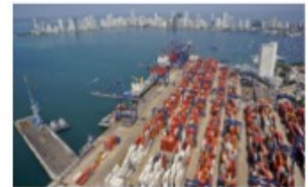
Importaciones VUCE 2.0